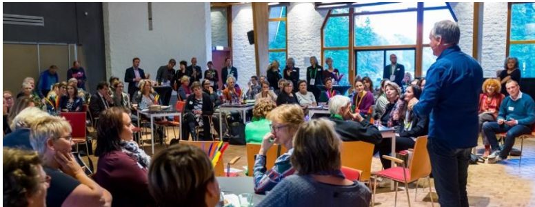
Foto: Slotconferentie Vrijwillig Dichtbij op 1 november 2018.

2018 Was het laatste jaar van het vierjarige programma Vrijwillig Dichtbij, waarin 14 landelijke vrijwilligersorganisaties samenwerkten om lokale afdelingen en geledingen beter toe te rusten en meer slagkracht te geven.