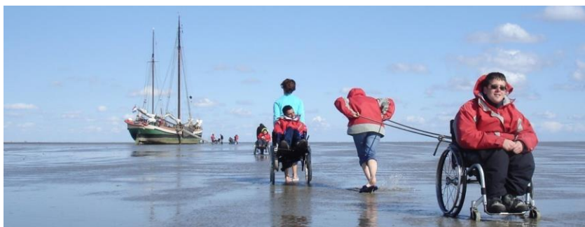
Foto: Eerste homepagefoto van het nieuwe platform.

Eind 2018 is NOV in gesprek gegaan met Movisie over het samenvoegen van Vrijwilligerswerk.nl met het Platform Vrijwillige Inzet. Zowel Movisie als NOV zien dat het brede vrijwilligerswerk gebaat is bij één landelijke platform. Hierdoor verrijken we het Platform Vrijwillige Inzet met een grote hoeveelheid kennis en kunnen we vrijwilligerscentrales en onze andere leden zichtbaarder en toegankelijker maken voor mensen die bijvoorbeeld vrijwilligerswerk of advies zoeken.