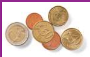
Koopkracht & Inkomen