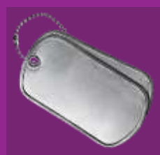
Defensie & Internationale Veiligheid