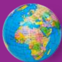
Immigratie en integratie