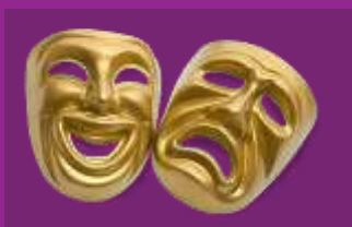
Cultuur en (Social) Media